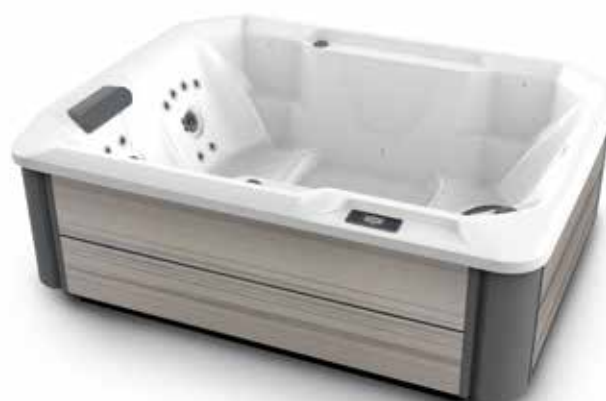
Modèle Stride avec coque Blanc alpin et habillage Amande.